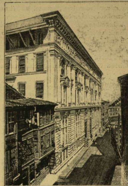
AZ OTTOMÁN BANK ÉPÜLETE KONSTANTINÁPOLYBAN.