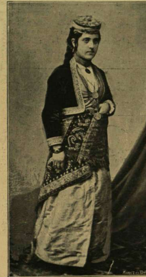
ELŐKELŐ ÖRMÉNY NŐ TRAPEZUNTÓL.