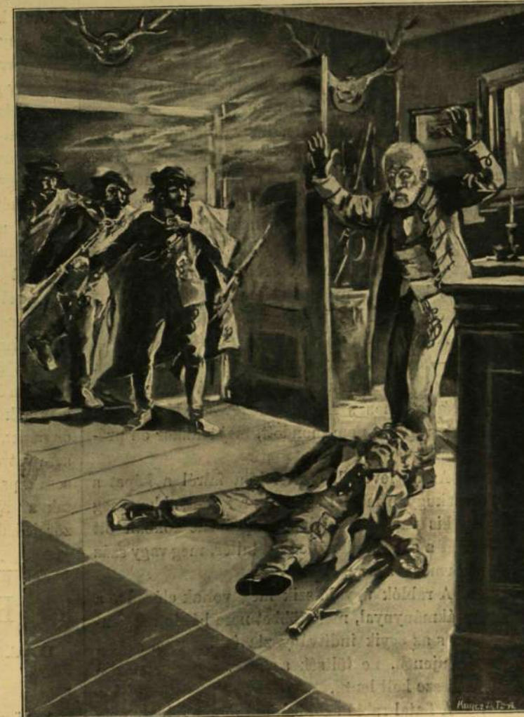
Az erdész holtan terült el a földön.

Azzal hirtelen fölugrott az erdész, gyorsan