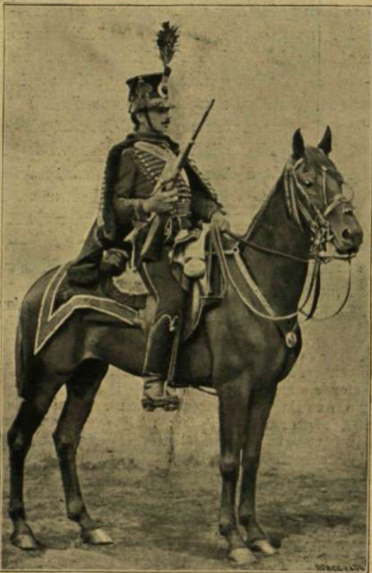
EGY MÚLT SZÁZADI PÁLFFY-HUSZÁR.

A német császár huga Budapesten. A német császár testvérhuga Sarolta , a szász-meiningeni uralkodó-herceg felesége, e hó 8-ikán a kiállítás