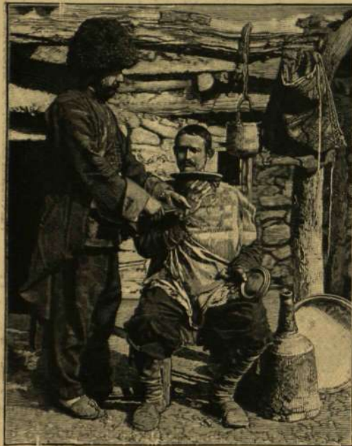
ÖRMÉNY FALUSI BORBÉLY.

A látszatos műveltség és nyugati szellem mögött rejtőző naiv bárdolatlanság az akkori