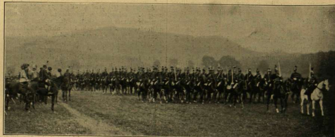
PÁLFFY-HUSZÁROK DÍSZSZEMLÉN A JUBILEUMKOR.

megtekintésére Teodora leányával Budapestre érkezett. Üdvözlésére megjelent a pályaudvarban a budapesti német konzul. A hercegnő a Hungária fogadóban szállt meg s a délutánt a kiállításon töltötte, este az operaszínházban «Hunyadi László» előadását hallgatta meg. A hercegnő egy hétig marad Budapesten.