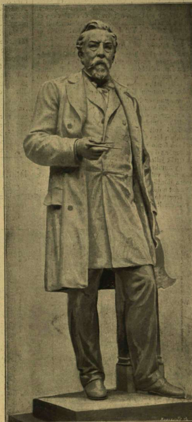
YBL MIKLÓS SZOBRA MATYER EDÉTYŐL.

A bécsújehlyi torna- és vívó-tanító tanfolyam kiállítása egy külön csarnokot foglal el, melyben az e szakba vágó sokféle fegyverek, öltözékek és minták láthatók.