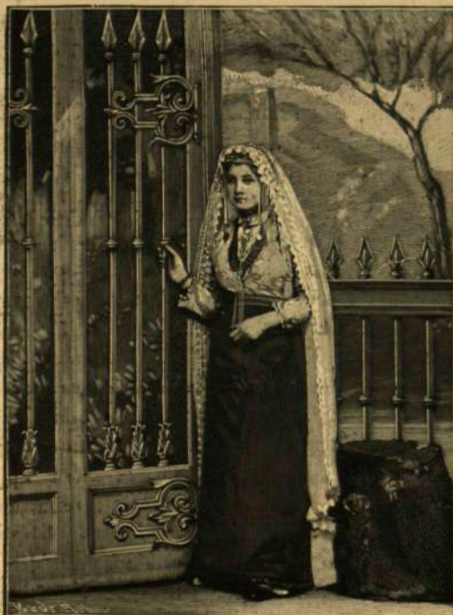
ELŐKELŐ ÖRMÉNY NŐ NEMZETI VISELETBEN.