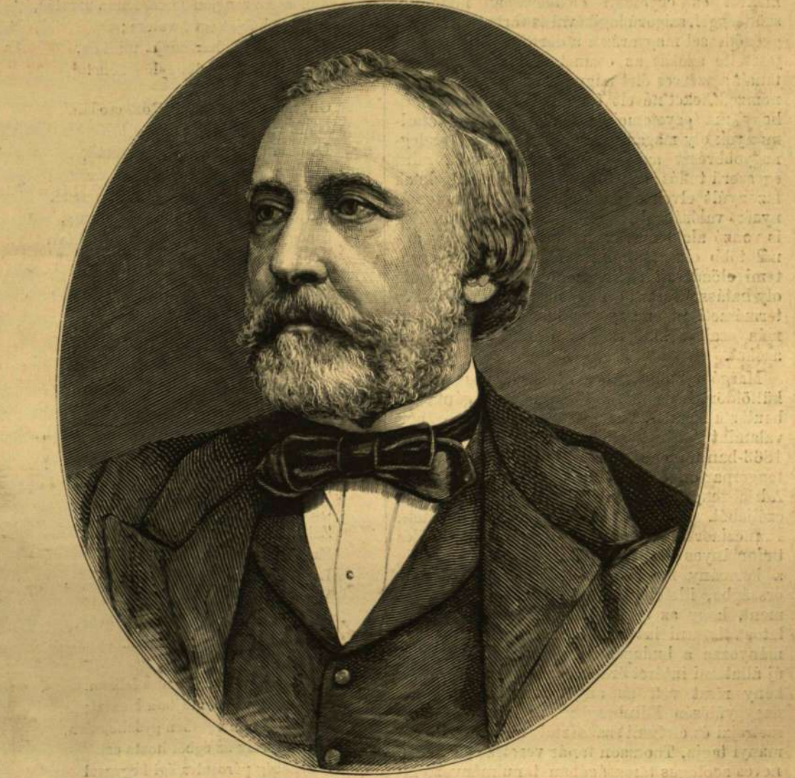
MARGÓ TIVADAR.

még jobban gyarapítsa, 1859-ben ismét Bécsbe ment s ott az egyetemen Brücke és Ludwig tanárok élettani műtermében dolgozott. Itt az izomrostok finomabb szerkezetére és fejlődésére vonatkozó vizsgálódásai, melyek eredményei a bécsi tud. Akadémia értesítőjében meg is jelen- tek, tetemesen fokozták s a külföldön is elter- jesztették hírnevét. Ugyanebben az időben fe- dezte föl s majd köztudomásra is juttatta azt a nevezetes dolgot, hogy a mozgató idegek az izom- rostok belsejében végződnék. Tudományos ér- dekeit az osztrák kormány azzal kívánta volna elismerni, hogy tanári állásra akarta kinevezni