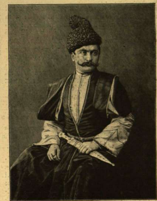
ÖRMÉNY FÉRFI NEMZETI VISELETBEN.

mény az lett, hogy három billiard-asztalt tönkretett s kártérítésül 1500 forintot kellett a kávésnak fizetnie. De mi volt ez akkor, a mikor virtusnak tartották ezer forintos bankjegyeket használni pipagyújtónak. Ezt is megtették a horvát urak, csak úgy, mint a magyarok. Természetesen nem kell e miatt olyan nagyon elszörnyükdönni, mert hisz az ilyen stílik csak annyiba kerültek, a mennyit az állam-bankrott szomorú idejében a teljesen értékét veszített oszt-rák papírpénz érhet a mi pedig egyenlő volt a semmivel.