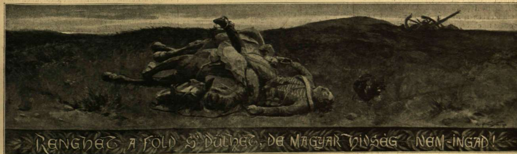
A HUSZÁR HALÁLA.