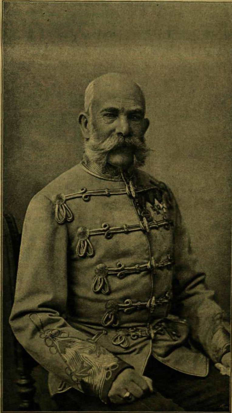
KIRÁLY Ő FELSÉGE LEGÚJABB ARCZKÉPE. Koller utódainak (Forché és Gálly) a koronázás emlékképe alkalmával fölvett fényképe.

féle állásban levett daliás, majdnem fiatalosnak mondható alakot, dőlczeg, egyenes tartásával és derült arcvonásaival: aligha hinné el, hogy egy olyan fejedelmet lát maga előtt, a ki immár a hetedik évtizedet tapossa, s a kinek a vállait majdnem egy fél évszázad óta nyomják az ural-