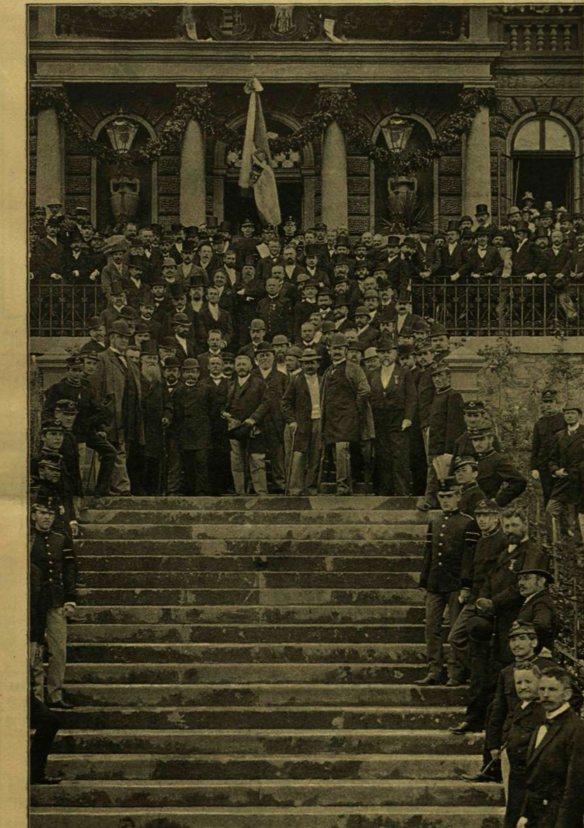
A SELMECZBányái Bányászati és Erdészeti Akadémia új épületeének fólavatási ünnepélyéről.