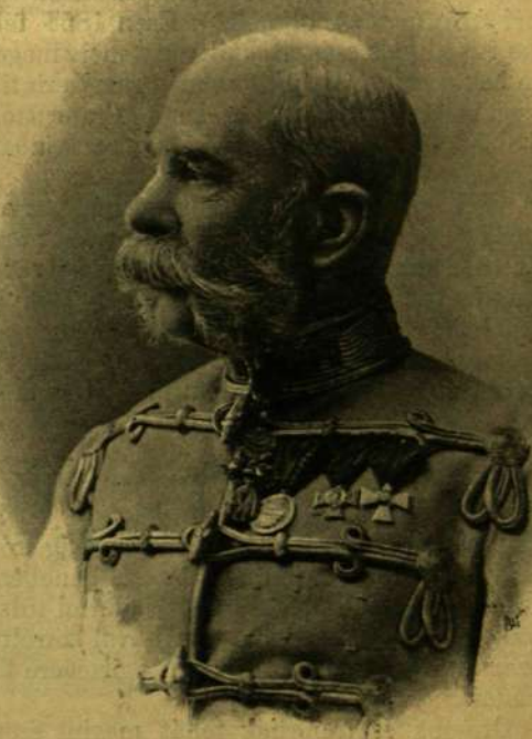
KIRÁLY Ó FELSÉGE LEGÚJABB ARCZKÉPEI.

Koller utódainak (Forché és Gálffy) a koronázás emléktünnepé alkalmával fölvetett fényképei.