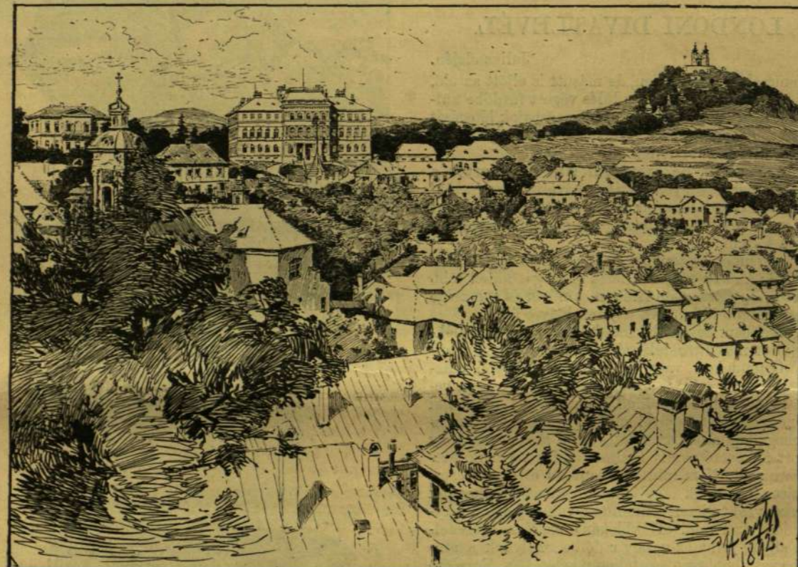
Baker Alajos fényképe után rajzolta Hary Gyula. A SELMECZBányái Bányászati és Erdészeti Akadémia új épülete és környéke.

Az országos középiskolai tanár-egylet közgyűlése az idén Pozsonyban ment vége és h 4-ikén kezdődött, Berecz Antal elnökle alatt. Több mint 150 tanár gyűlt össze, kiket a pozsonyiak szívesen