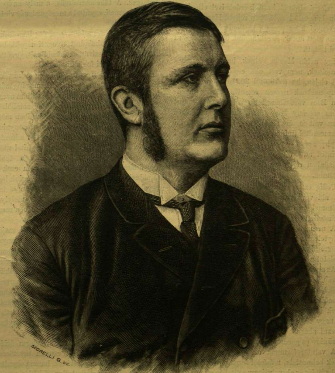
WEKERLE SÁNDOR PÉNZÜGYMINISZTER.