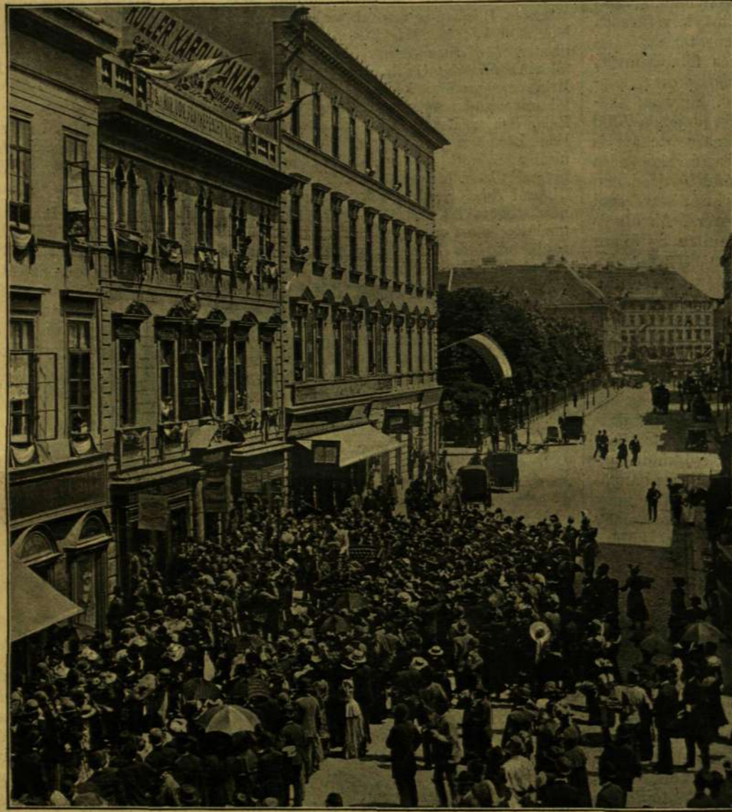
A KIRÁLY TÁVOZÁSA KOLLER UTÓDAI MŰTERMÉBŐL A FÉNYKÉPEZÉS UTÁN, JUNIUS 9-ÉN.