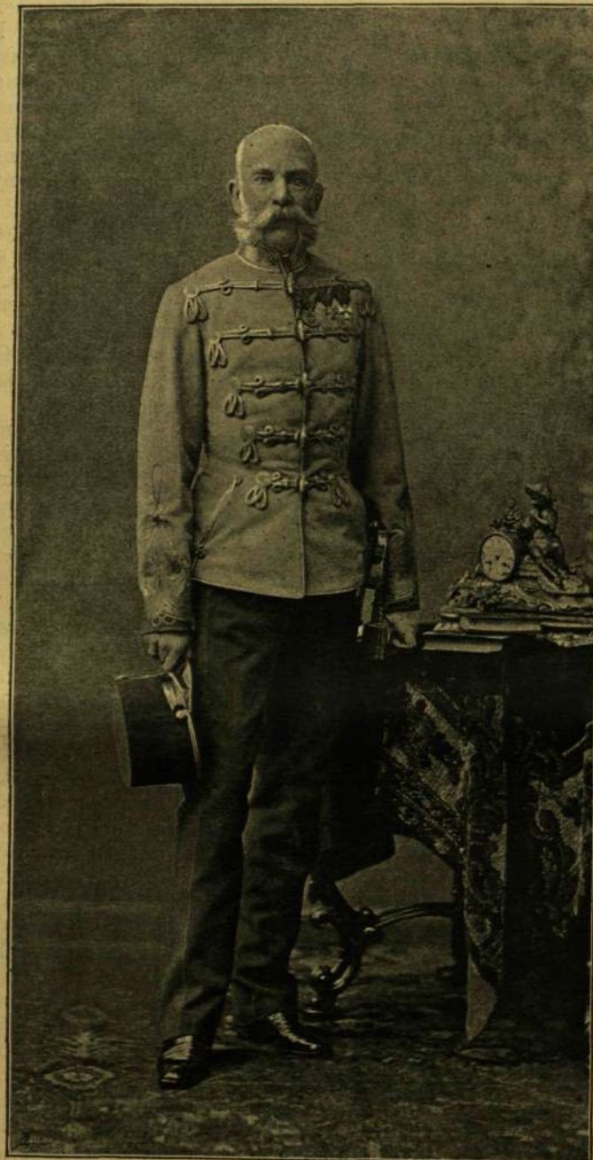
KIRÁLY Ó FELSÉGE LEGÚJABB ARCZKÉPEI.

Koller utódainak (Forché és Gálffy) a koronázás emléktünnepé alkalmával fölvetett fényképei.