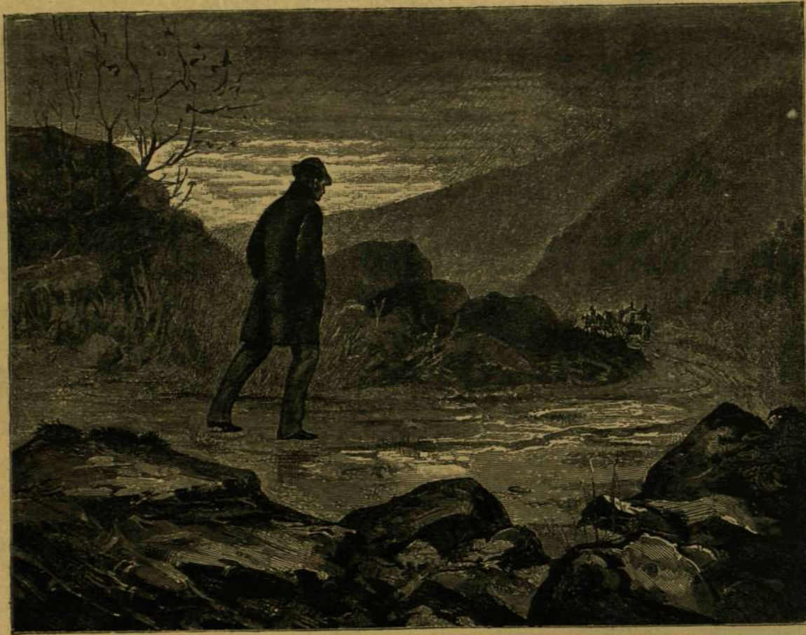
NYOMA VESZETT! — GYORSAN S EGYENLŐ LÉPÉSEL HALADOTT.

déglős-pár az érkezendőt egy pár palaczk bor mellett várták.