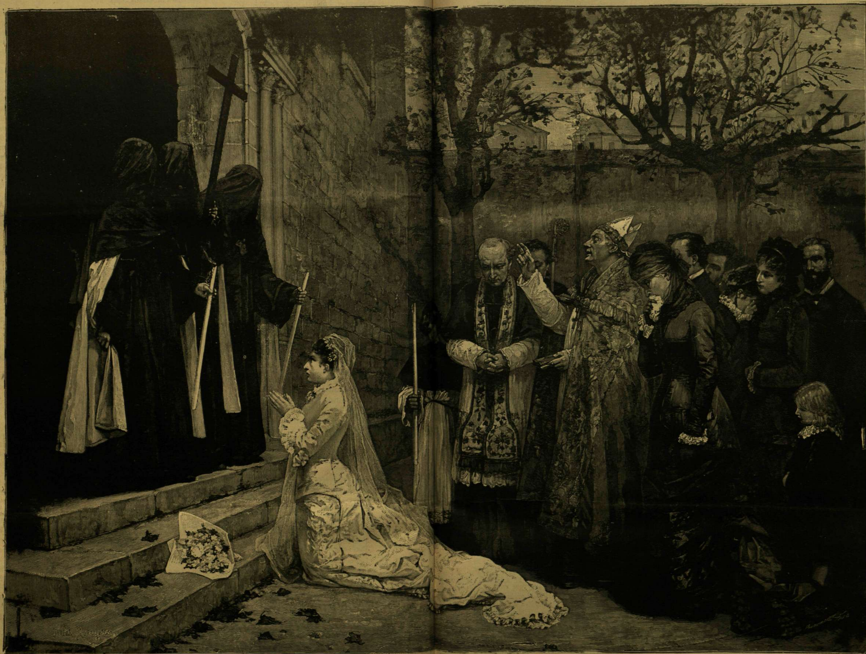
A ZÁRDARÜSZÖBÉN. ROUGERESTMÉNYE.