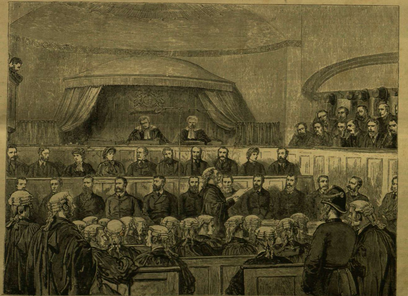
AZ IRLANDI LAND-LIGA PÖRÉNEK TÁRGYALÁSA DUBLINBAN.