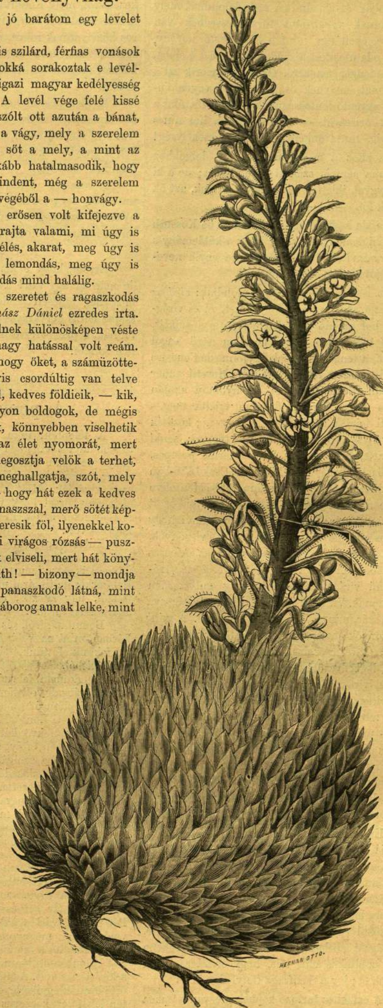
Saxifraga florulenta & Morelli

Láttam azt az államtag oroszánt is, mely nem bír fölcusdani, hogy karmának egy csapásával kettétörje a lánczot, szabadítsa föl Prometheus karját, hogy védhesse önmagát és másokat asoktól s még más fajta keselyűktől is. — — — — —