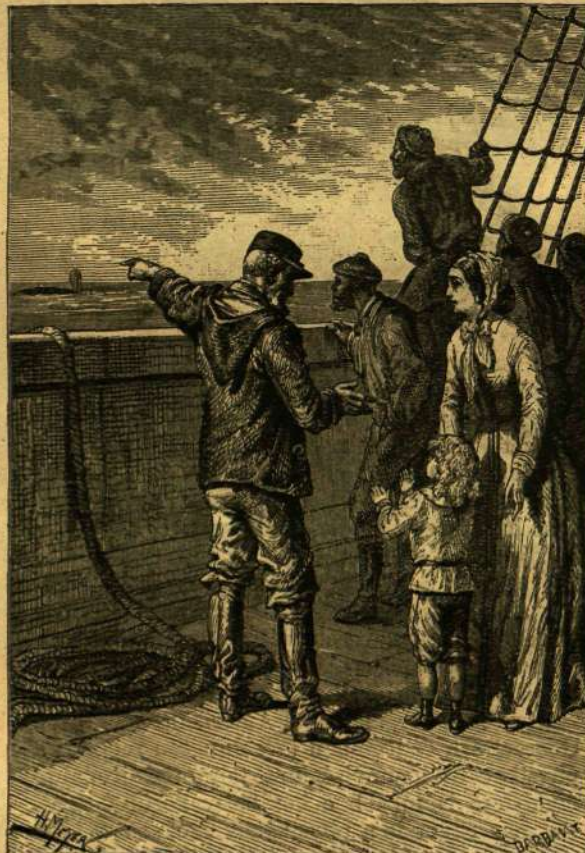
BE SZÉP! ÚJJONGOTT A KIS JAKAB.