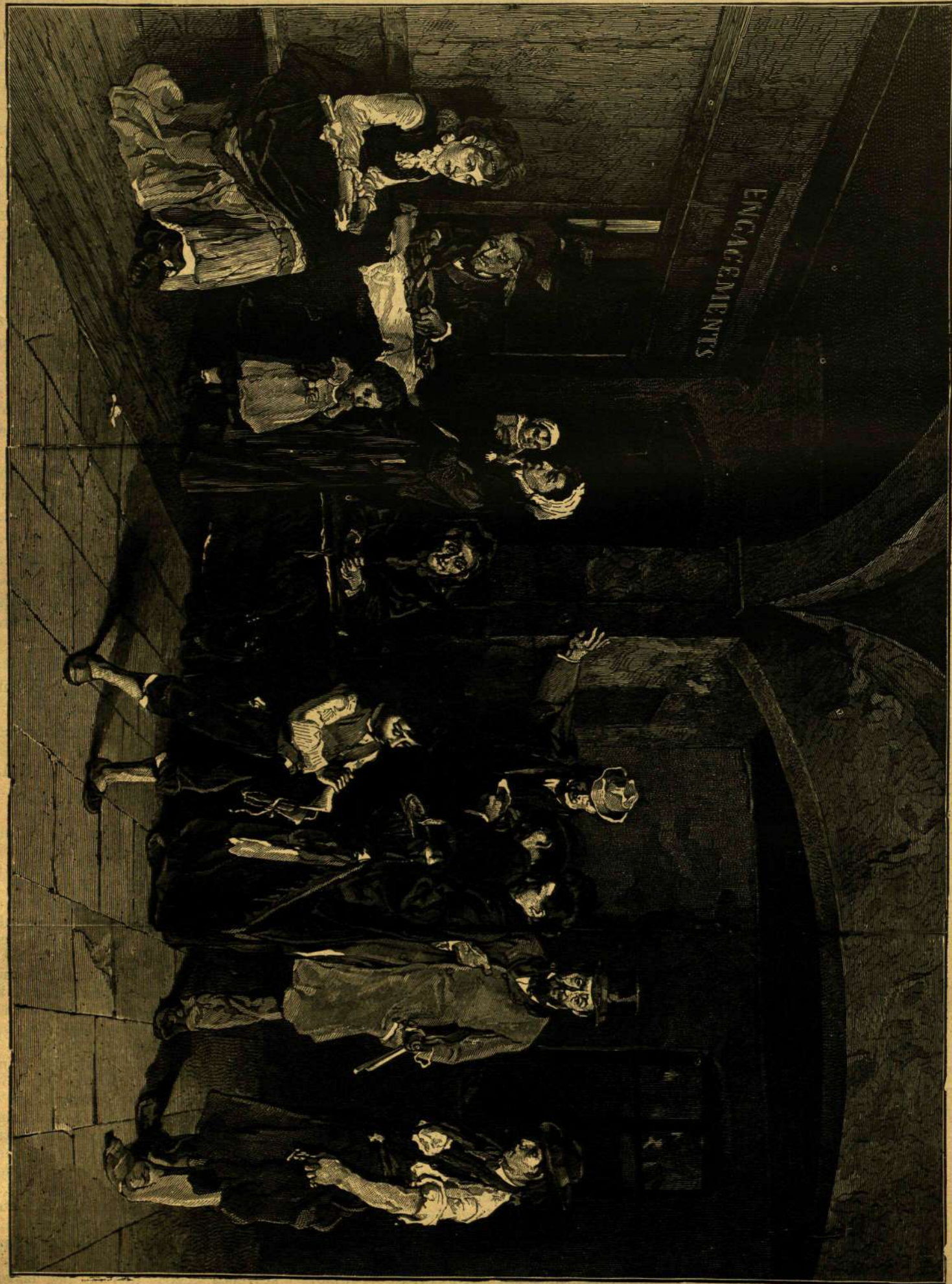
A ZÁLOGHÁZBAN. — MUNKÁCSY MIHÁLY FESTMÉNYE UTÁN.