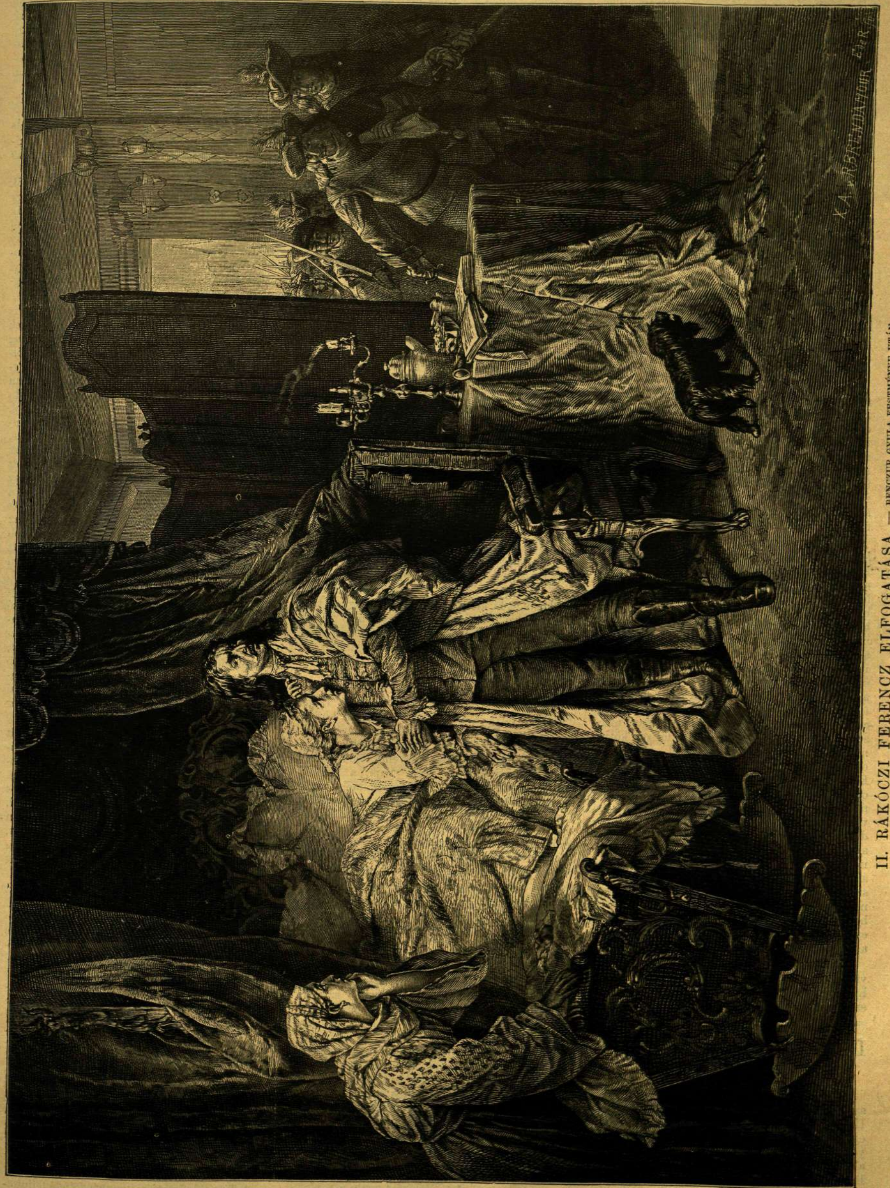
II. RÁKÓCZI FERENCZ ELFOGATÁSA. — BENZÜR GYULA FESTMÉNYE UTÁN.