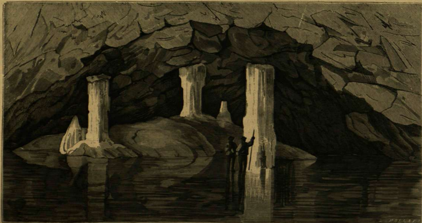
DOBSINAI JÉGBARLANG: Jégterem.

azt még nem is sejtették, mert a meredeken lenyúló szűk nyíláson behatolni senki nem mert.