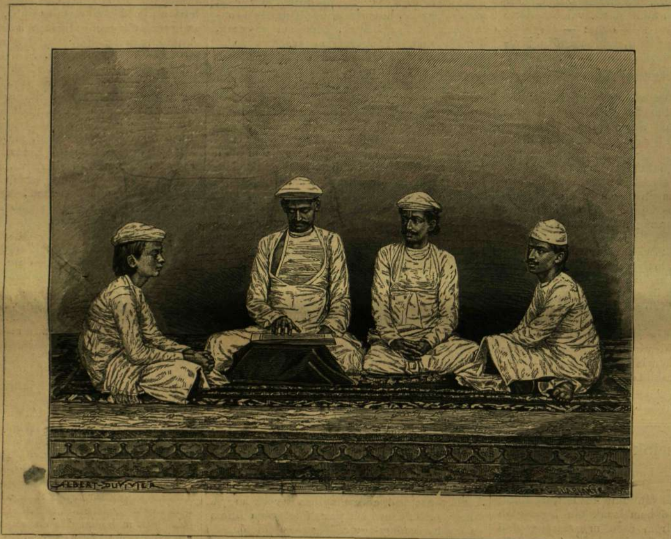
KELETINDIAI KÉPEK: Brahminok.

Nem lehet más mint követjelölt! Evansvilében történt nem régen, hogy egy részeg ember a városban kívül levő árokba esett, s oly nehéz volt a feje, hogy a maga erején nem tudott onnét kivergődni. Egy arra menő ur olyan jószívű volt, hogy