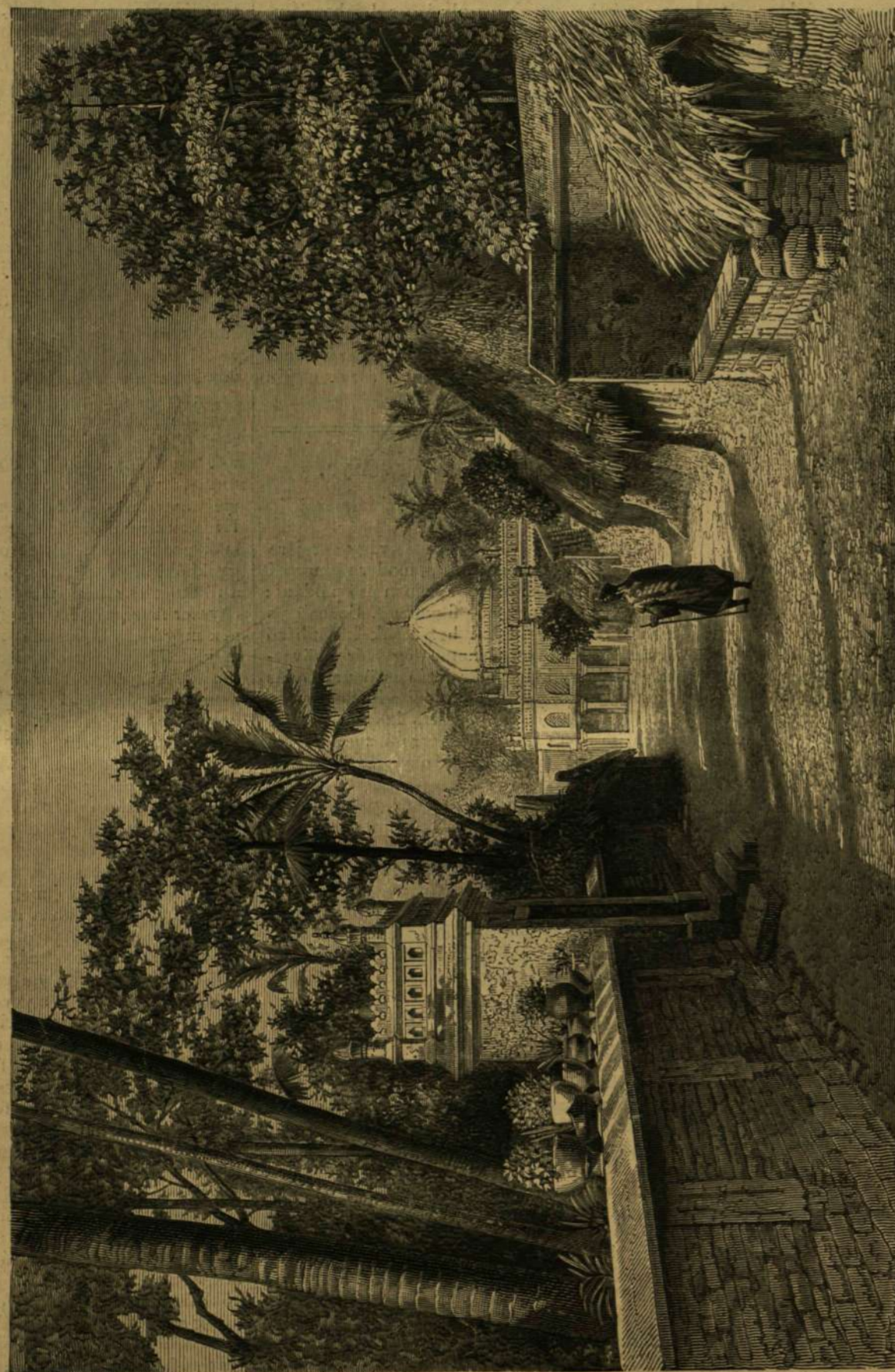
KELETINDIAI KÉPEK. Nuthuri mecses.

A jég tükre, nagy darabon, majd egészen vízszintes, csak itt-ott látható rajta egy kis mélyedés, míg a jégdomb felé lassacskán emelkedik. E helységnek hegyes zugban végződő, keleti végén szétmorzsalódott sziklatömegek-ből jókora kupacz látható, melynek laza törme-