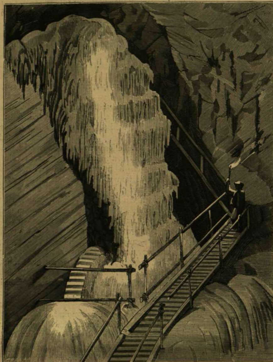
DOBSINAI JÉGBARLANG: Jégugas.

Bátran rálephetünk a sima lapra, mely már nem egyszer, meleg nyári napokban, fűrgő korcsolyázók tomboló tere volt. Cseppet sem kell félni, e jégtömeg roppant vastagsága elhárít minden aggodalmat, hogy a jég beszakadhatna. Lábaik alatt a ropogás legnagyobb részét a leválatott jégkristályoktól származik, melyek, nagyok és nehezek lévén, csörömpölve hullanak le a padlózatra.