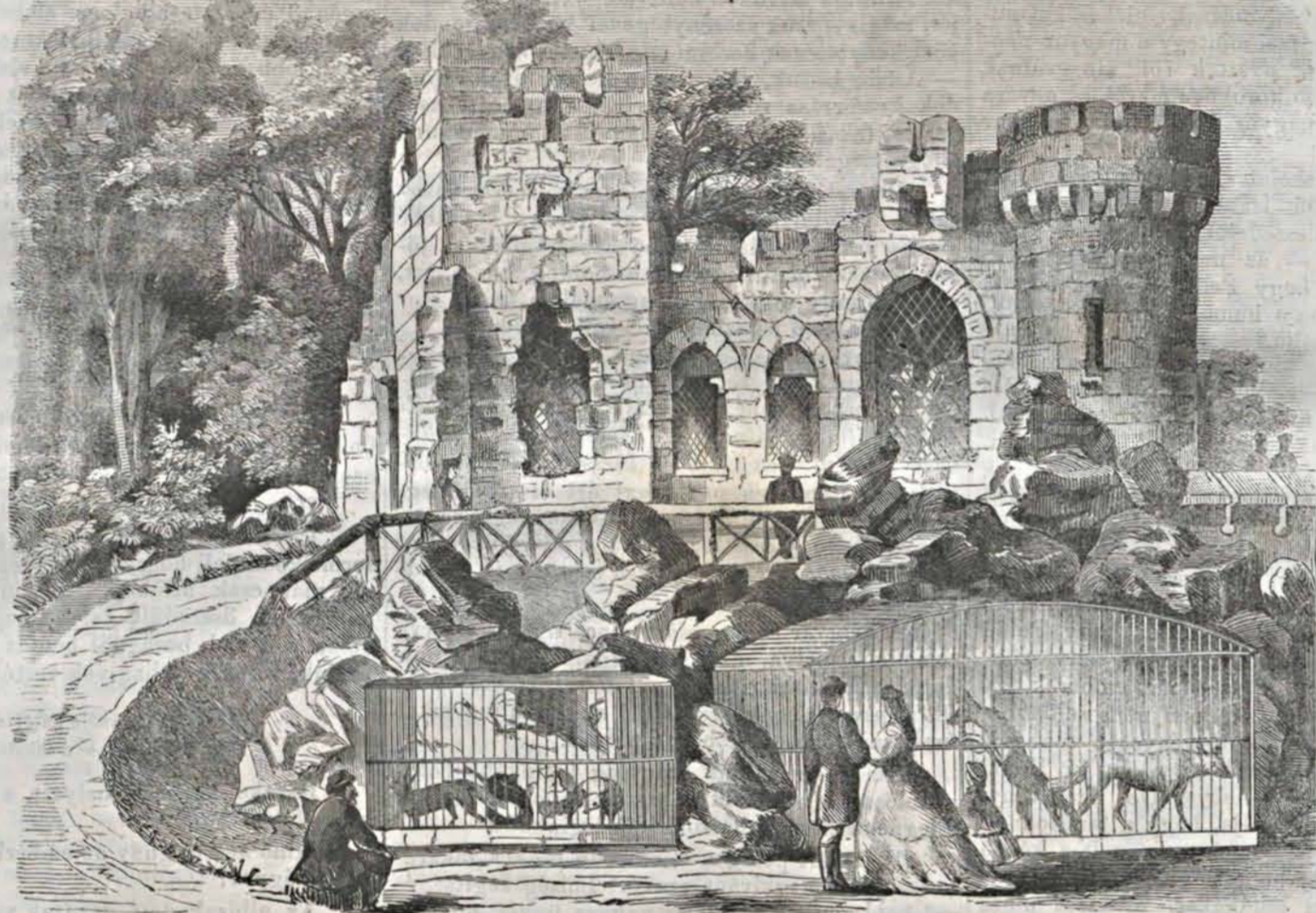
Képek a pesti állatkertből: I. A bagolyvár.

Egy ily persa rabszolga rajzát mutatja mel-lékelt képünk, Vámbéry ázsiai utazása nyomán.