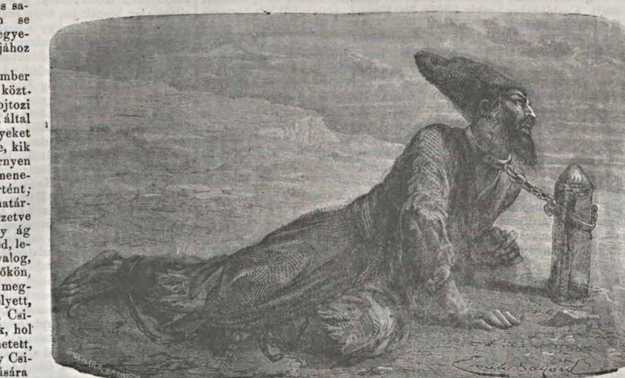
Persa rabszolga a turkomanok között.

1799. Eladtam a szőlőt ne-mes Szabó Ferencnek 32 fo-