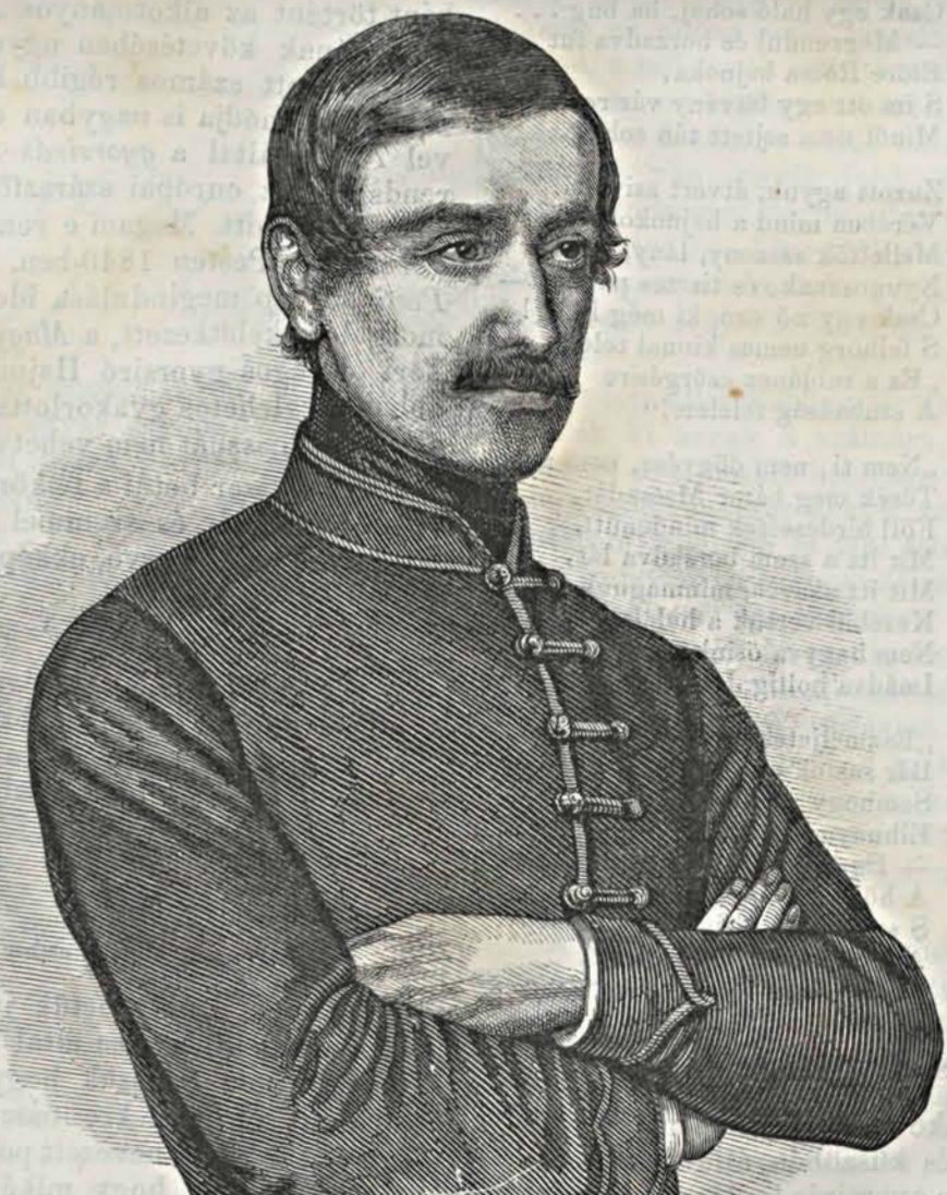
GRÓF TELEKI LÁSZLÓ.

1849-ban september ele-jén érkezett Párisba s állomá-sát az események borultaig hí-ven betölté. A világsági kata-stropha után e hivatalos jelle-me megszünt ugyan, de gróf Teleki folyvást Párisban ma-radt, a journalistikai s társa-