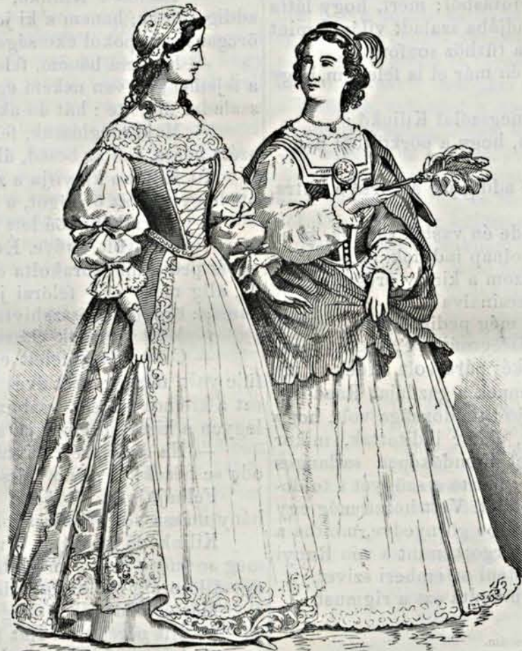
Magyar női viseletek a XVIII. századból: III. Nyári öltözék.

Az erdélyi nők a füző-váll felső végén elől nagy arany vagy ezüst, drágaköves boglárt vagy csatot is viseltek; ezen boglár hajdan a diadalmask jelvénye volt.