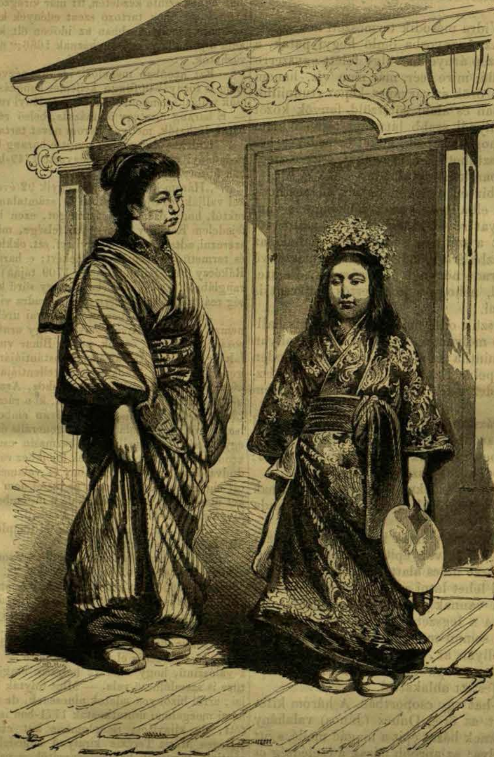
Japáni kép: Simodai nő és leánya.

Végül megemlítjük, hogy a debreczeni tűzoltó deákság menetét feltűntető természetű rajzot, ottani főiskolai rajztanár Kallós Kálmán ur szivességéből és műve után közöljük.