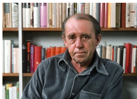
Heinrich Böll (1917-1985)

Szinte említésre sem méltó hír, ezért elég volt egyszer bemondani a rádióban illetve a TV-ben. Az újságok nem közölték, utólag is csak egy helyen talákoztam e ténnyel. Részleteket nem tudtam meg, de derék katonazenészeink bizonyára egészen kiválóan végezheték munkájukat, öregbítve hírnevüket és kellően fokozva az önálló énekléstől eléggé elszokott tömeg hangerejét. Valóban megnyugtató ez. Elég sokáig vártunk erre a megnyugtatóra. Hosszú éveken át a karhatalom inkább megfigyelte és kordában tartotta, mintsem támogatta az egyházi körmeneteket. Volt abban egy kis civil kurázsizs, hogy az ember végigment az évek során egyre rövidülő útszakaszon, s megpróbált bekapcsolódni az itt-ott feltörő énekbe. Jól szervezett éneklés talán gyanús is lett volna a féltékenységet elváró megfigyelők számára. Mostanra azonban minden megváltozott.