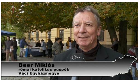
Beer Miklós római katolikus püspök Váci Egyházmegye