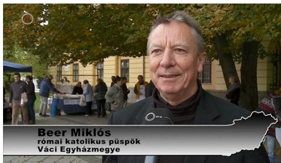
Beer Miklós római katolikus püspök Váci Egyházmegye