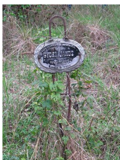
Egy még látható sír a Duna deltájában