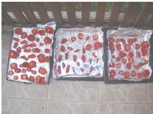
Az első kísérletet süti a nap.

Egyelőre a majdnem papírvékonyra kiszikkadt paradicsom szeletek fűszeres olajjal feltöltött üvegekben várják a „a puding próbáját”