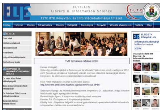
Az ELTE BTK KITI honlapjának egy részlete

ményében, évek óta, rendre az elsőnek rangsorolt magyar karán működő intézetünk képzési programját választó szakemberjelöltek elsajátíthatják a legkorszerűbb könyvtár- és információtudományi eredmények elméleti és gyakorlati hátterét, hogy önálló gondolkodású, alkotó és – az infokommunikációs modernizáció hatására rohamléptekben fejlődő, egyúttal rendkívül szerteágazó – interdiszciplináris értelmiségi pályán kamatoztathassák tehetségüket az információs és tudástársadalom intézményeiben: a könyvtárakban és kulturális irányultságú nonprofit szervezetekben épp úgy, mint piaci információs szolgáltató vállalkozásokban és nagyvállalati információs központokban vagy a közigazgatásban, valamint bármely, információs szakképzettséget igénylő területen. ■