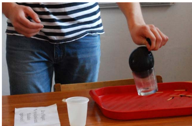
4. ábra. A pohár felemelése másodszor már sikeres volt, bár első próbálkozásra a gyufa égése miatt a lufi szétrobbant.

Az utolsó kísérlet ismét a felületi feszültegről szólt, ahol egy szabályos tetraéder alakú drótkeretet szappanoldatba mártva figyelhették meg a kialakuló szappanhártyát. Itt a kód egyetlen számjegyből állt, amely a következő kérdésre adott válaszukból származott: „Hány különálló síkfelülete van a szappanhártyának?” A helyes válasz eredményeként első alkalommal a csapatok közösen kinyithatták a dobozt, amelyben a Torricelli-kísérlet vizes változatához szükséges eszközök voltak bezárva és közösen, tanári irányítással végezhettek el a mindenki számára tanulságos kísérletet.