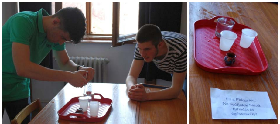
3. ábra. A felületi feszültség tanulmányozása három pohár víz segítségével.

Így juthattak el a harmadik kísérlethez: „Használjátok a 2 literes pillepalackot. Lyukasszatok ki 5, 10, 15 cm magasságban és mérjétek meg, ha megtöltitek vízzel, milyen távol ér földet a vízszugár a palack szélétől. Milliméterpapíron ábrázoljátok a lyuk feletti vízoszlop magasságát a távolság függvényében.” A kódot a parabola szó egyes betűinek megfeleltetett számokkal kapták a diákok az 1. táblázat szerint.