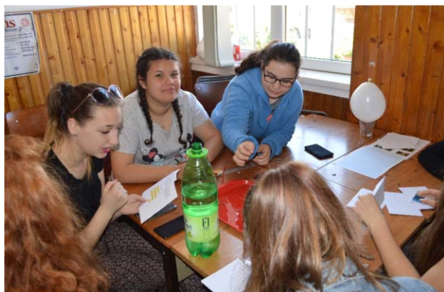
1. ábra. Az első kihívás a csapatmunka során a feladatkörök leosztása, illetve a szövegértelmezés.

állnak. Ugyanakkor bárki kidolgozhat saját feladatlapokat is. Számunkra ez utóbbi kézenfekvő, hiszen a feladatlapokat mindenképpen le kellene fordítani angol nyelvből, ugyanakkor nem feltétlenül alkalmazható sem a magyar, sem a román tantervi követelményekhez illesztve. A két szolgáltató csak elvéve ajánl fel gimnáziumi szintű fizika témaköröknek megfelelő szabadulójátékokat, így saját kreativitásunkat is fejlesztve aknázhatjuk ki ezt a tanítási módszert.