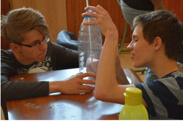
2. ábra. Az együttműködés, a feladatok leosztása a hatékony csapatmunka záloga.

kódot kell megtalálnotok és a megfelelő kóddal megjelölt boríték felbontásával utazhattok egyik folyótól a másikig, míg el nem éritek a Sztüx vizét.”